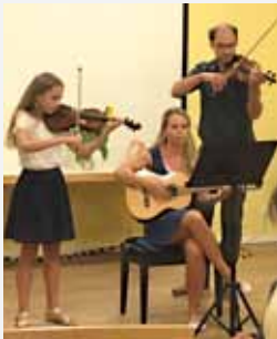
12 Schnupperkurs Frühjahr