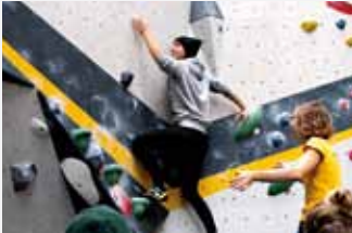
13 Bouldern in Passau